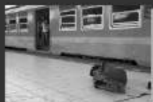
Thibault Gregoire Bélgica / Indonésia