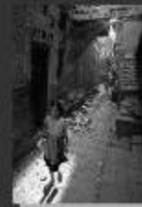
Nuno Moura Portugal